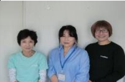
山中 杉山 島塚