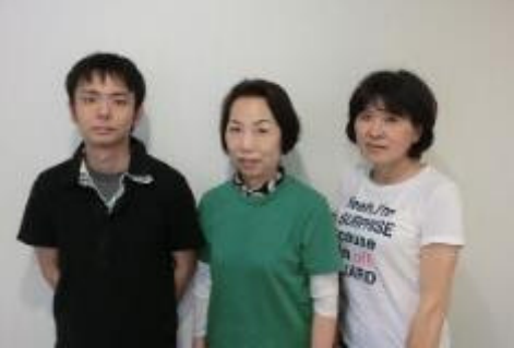
坪内 松原 東垂水