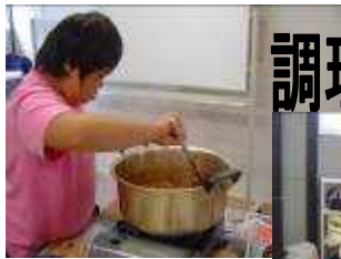
調理実習・交流会