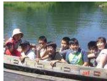
外出訓練 アクアト